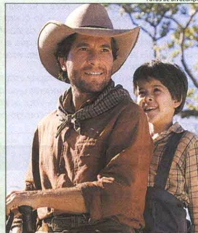
“SE EU FOSSE VOCÊ VOCÊ 2”, “As melhores coisas do mundo” e “O menino da porteira” estão entre os filmes que passarão no Cine Tela Brasil, a partir de amanhã.